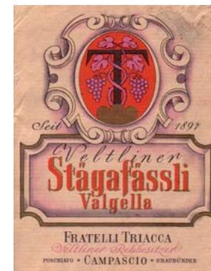
Weinetikette aus den 50er-Jahren, zeigt damals schon werbliche Elemente der Markenprofilierung