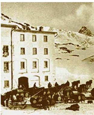
Weinlieferung ins Engadin, mit Erholungspause auf dem Bernina-Hospiz, um 1900. Die Fässer waren mit F.T. bezeichnet.

Und das ging so weiter bis zum 2. Weltkrieg. Da konnten die Triaccas dank eines Sonderstatutes zwar weiter grenzüberschreitend wirken. Aber nur einer von ihnen durfte einmal in der Woche im Valtellina nach dem Rechten sehen: Weinbereitung unter stark erschwerten Bedingungen. Aber auch diese Schwierigkeiten wurden überwunden.