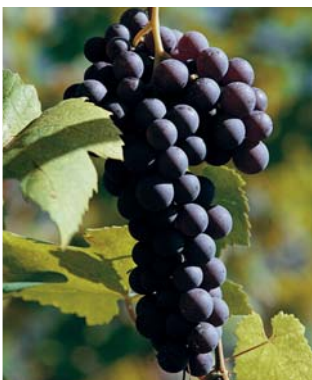
Der Klonprozess dauerte Jahre. Von anfänglich 213 Rebstöcken der ausgewählte Klon 128.