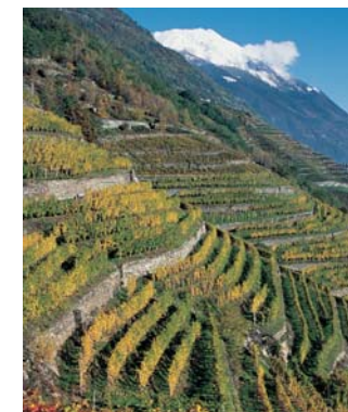
Herrliche Berg- und Reblandschaft im Valtellina. Querterrassierung brachte Erleichterung und bessere Arbeitsbedingungen.