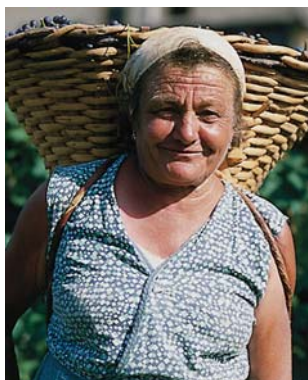
Alle mussten anpacken und die schweren Körbe zu Fuss ins Tal hinunterbringen.