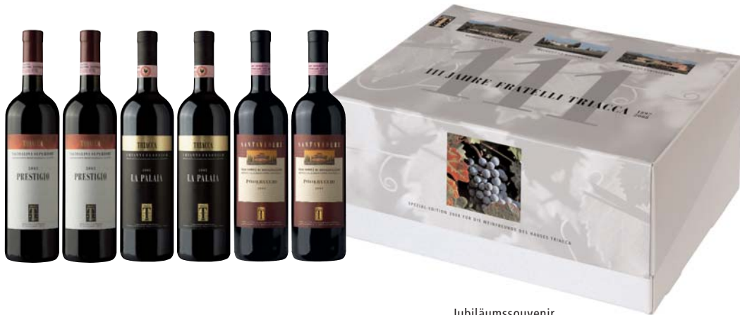
Jubiläumssouvenir mit sechs Premiumweinen

14 111 Jahre Stammbaum der Familie Triacca 1897–2008