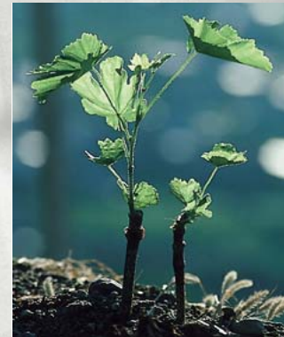
«Dalla mia vigna» Seit 111 Jahren dem Weinbau verpflichtet. Mit eigenen Reben aus unseren Weinbergen.

Obwohl es so aussieht, als entfernten wir uns geografisch immer weiter von unserem Stammland, dem Valtellina, dem Val Poschiavo, bleibt unser Hauptsitz dort, wo er während der 111 Jahre schon immer war, in Campascio. Und wir werden bleiben, was wir sind: ein Schweizer Familienbetrieb.